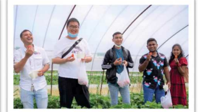
とちおとめ、最高です！ とても大きないちご、いただきました。