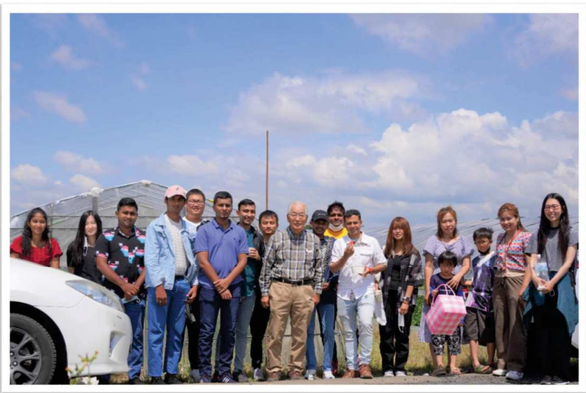
とちおとめ、とてもおいしかったです！ ありがとうございました！