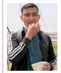
楽しかったです！ いちご摘み、来年もやりたいです！ おいしいイチゴ、ありがとうございました！