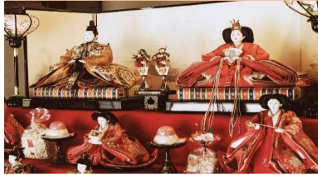
「ひな人形のひな飾り」

3月3日は「ひな祭り」として、家の中で人形を飾る風習があるのですが見たことはありますか？ まず「ひな祭り」とはどのようなものなのでしょうか。