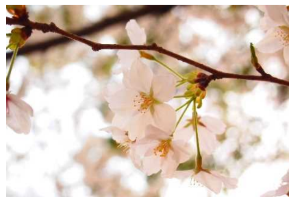
開倫塾 日本語学校

春になるとお花見をする際に外に出てお酒を飲む機会があるかもしれません。しかし、ちょっと待ってください。日本の法律では、20歳にならないとお酒を買ったり、お店で飲んだりすることができません。それだけでなくタバコも同様に、買う際に20歳以上であることを証明する証明書が必要です。 お酒とタバコは20歳になってから、と知っておいてください。