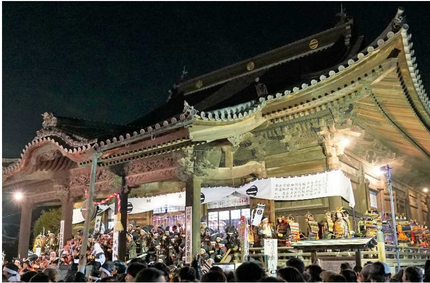
「国宝 鎧阿寺に集まった鎧武者姿の人々」

2月3日午後5時より、足利市の織姫公民館から足利大通りを通って国宝の鎧阿寺まで「足利鎧武者行列」の参加者が練り歩きました。 今回の参加者は三百名以上。中には遠くアメリカからも参加がありました。 この日は節分の日でもあり、鎧阿寺に集まった鎧武者姿の人々が、和泉市長の合図で豆まきを行いました。 境内に集まった観衆からも「鬼は外、福は内」の掛け声がかかりました。